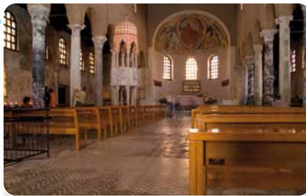
▲ Interno della Basilica di Sant'Eufemia a Grado

Il centro storico della città vecchia di Grado è interamente chiuso al traffico cosicché aggirarsi per colli e campielli, tra le case in pietra costellate di piccole finestre con le tipiche persiane verdi, è ancor più piacevole e suggestivo. La struttura urbanistica è ancora quella originale del paese medievale e numerose sono le testimonianze e gli edifici dell'epoca. Visitando la Basilica di Sant'Eufemia ed il suo Battistero, vi sembrerà che il tempo si sia fermato a un'epoca lontana. La suggestione continua percorrendo i vicoli pittoreschi che portano a raggiungere la centrale Piazza Marin, il vero e proprio fulcro della città vecchia.