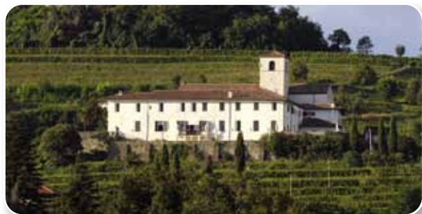
▲ Abbazia di Rosazzo